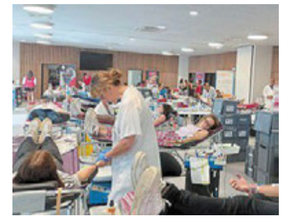
L'an dernier, la grande collecte du mois de juin avait eu lieu à l'Ice parc. Les 402 donneurs avaient contribué à sauver 996 vies. 710 dons sont nécessaires chaque semaine dans le département.

Quelle que soit son origine, tout le monde peut donner s'il est âgé de 18 à 70 ans, en bonne santé, pèse au moins 50 kg, et s'il a pris rendez-vous sur le site ou l'appli. Pour voir son éligibilité avant de venir la première fois, on peut réaliser un test en ligne sur le site de l'EFS. Le jour même, il faut venir bien hydraté, mais pas à jeun. Une collation géné-